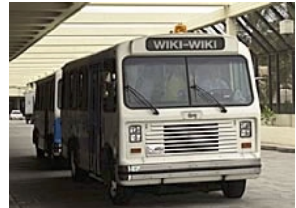
Das Wiki-Wiki Airport Shuttle, der Namensgeber.

Die Idee: Eine Webseite, die jeder schnell & einfach bearbeiten kann.